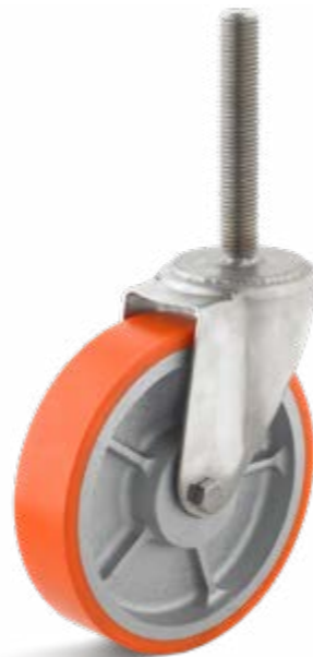
Unsere Lenkrolle für den Unterwasser-Einsatz mit Gewindezapfen zur Montage am Räumschild

Ergänzend zu den Bandagen-Rädern können wir Ihnen auch die erforderlichen Achsen nach einer Skizze oder Zeichnung anbieten.